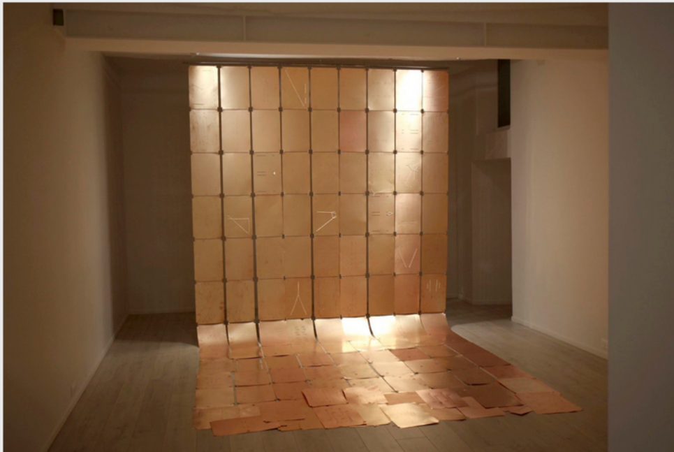
"Coppers", 2019 de Theresa TRAORE DAHLBERG - Courtesy de l'artiste et de la Galerie ANDREHN SCHIPTJENKO - Paris © Photo Éric Simon