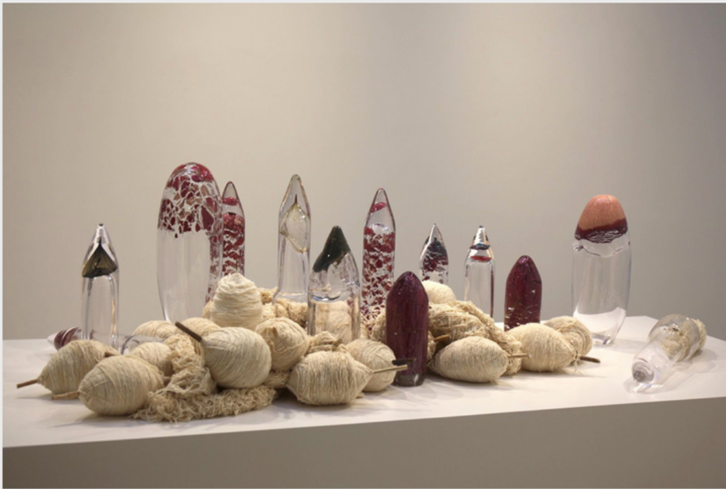
" Glass Capsule #1; #2; #3; #4; #5; #6; #7; #8; #9; #10; #11; #12; #13; #14; #15; ", 2023 de Theresa TRAORE DAHLBERG - Courtesy de l'artiste et de la Galerie ANDREHN SCHIPTJENKO - Paris © Photo Éric Simon

Après avoir été un élément fondamental de la fabrication de haute technologie, ces cartes de circuits sont aujourd'hui obsolètes, mises au rebut et témoignent de la transition économique. Certaines des cartes de circuits ont été brodées avec du fil de coton filé à la main provenant du Burkina Faso.