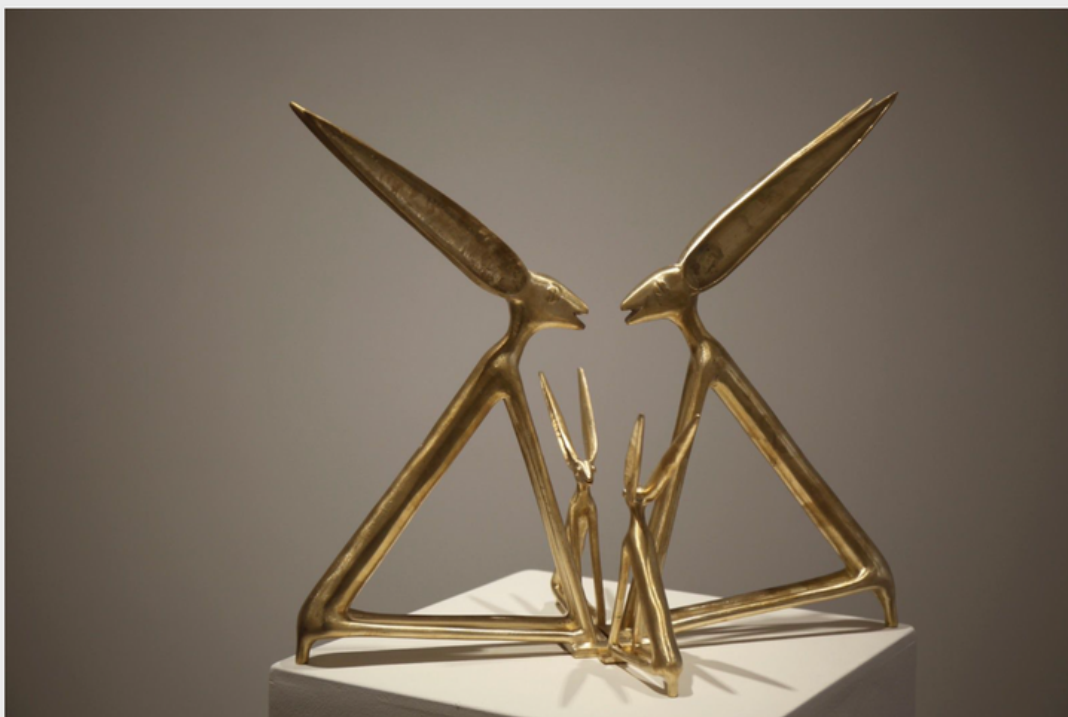
"Hakili installation", 2024 de Theresa TRAORE DAHLBERG - Courtesy de l'artiste et de la Galerie ANDREHN SCHIPTJENKO - Paris © Photo Éric Simon

Feb Publié par Eric SIMON - Catégories : #Expo Sculpture Contemporaine , #Expo Installation Contemporaine