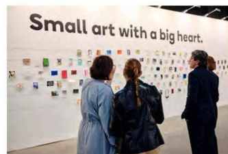
Art Brussels 2023, The KickCancer Collection.