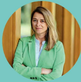
Directrice générale d'Art Brussels